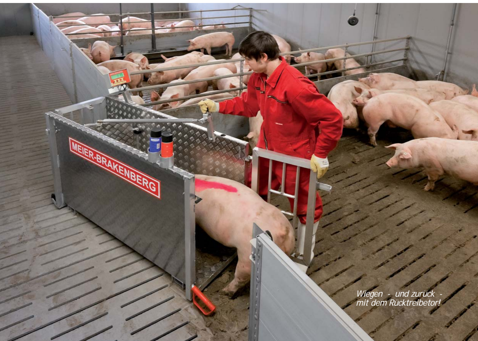
Wiegen - und zurück - mit dem Rücktreibetor!