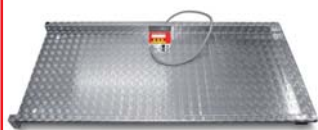
Wiegeplattform für 200er Kuhbetrieb an der Kraftfutterstation