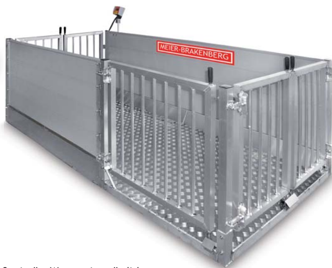
Stationäre Waage mit zusätzlichem Seitentor