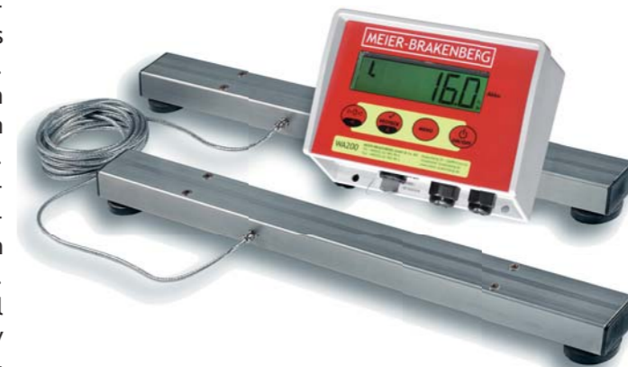
Die Wiegebalken ab 100 cm Länge können zwei Mal um 15 cm gekürzt werden. Wiegebalken bis 6 m Länge auf Anfrage.

Zur Nachrüstung bestehender Waagen bieten wir hochwertige Wiegebalken aus Aluminium und Edelstahl an. Die Wiegeelektronik hat ein Tierverwiegungsprogramm und tarirt sich automatisch. Die Wiegeeinheit ist wasserdicht vergossen und mit nagerunempfindlichen Kabeln auch vor Mäusen geschützt. Serienmäßig über Netzteil betrieben kann alternativ auch mit einem Akku gearbeitet werden.