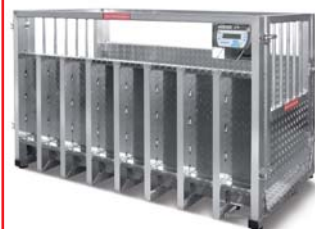
Bullenwaage für Exportverwiegung im Hamburger Hafen