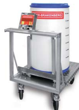
Fasswaage für chemische Industrie