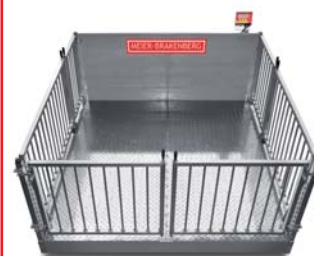
Drei-Wege-Kreuzung an Verladerrampe